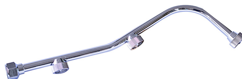
Boquilla 3 Salidas