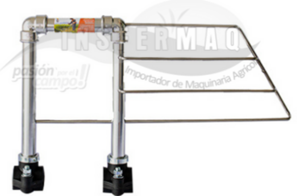
Organizador de Pasto