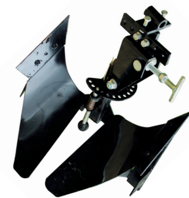
Reja de Arado Doble