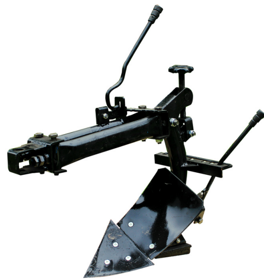
Arado Motoazadas 7 y 10 hp