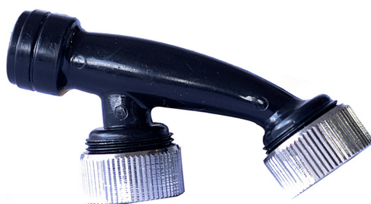
Boquilla 2 Salidas